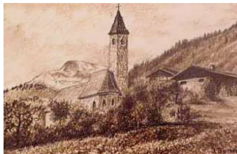
Rötzelzeichnung von Jogg Boner.

Nicht weit von der Grub stuhnde vormalen auch ein altes Schloss, genannt Badino oder Padina. Von der Grub voraussen