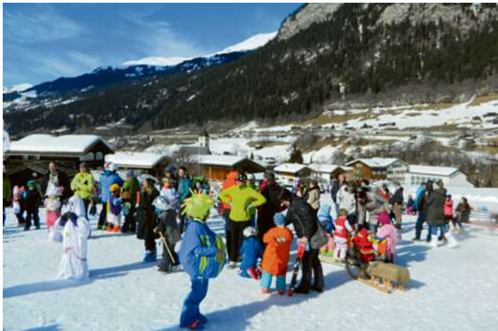
Das beliebte Verkleidungs-Skirennen findet jährlich statt.