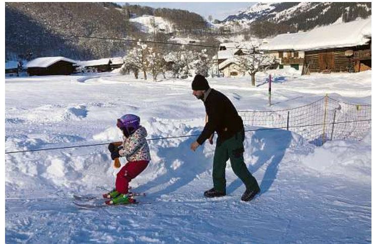
Hier lernte wohl ganz Serneus skifahren, am Mottalift.